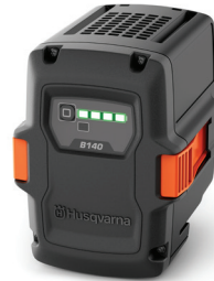
HUSQVARNA BLI40-B140 970 45 72-01