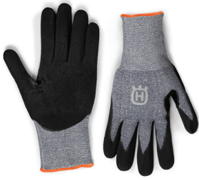
GLOVES, TECHNICAL GRIP 529 88 03-08