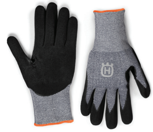
GLOVES, TECHNICAL GRIP 529 88 03-12