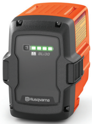
HUSQVARNA AKKU BLI30 967 93 77-01