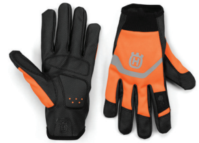
GLOVES, FUNCTIONAL LIGHT NON-SLIP 529 88 02-07