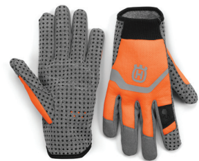
GLOVES, FUNCTIONAL LIGHT VENT 529 88 01-07