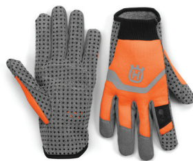
GLOVES, FUNCTIONAL LIGHT VENT 529 88 01-09