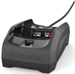
QC40-C80 970 48 78-01