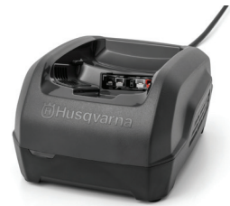
HUSQVARNA QC250 LADEGERÄT 967 97 01-01