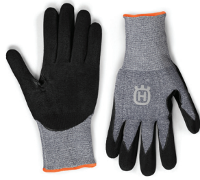
GLOVES, TECHNICAL GRIP 529 88 03-09