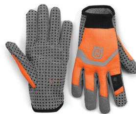
GLOVES, FUNCTIONAL LIGHT VENT 529 88 01-10