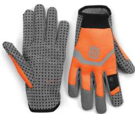
GLOVES, FUNCTIONAL LIGHT VENT 529 88 01-08