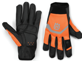
GLOVES, FUNCTIONAL LIGHT NON-SLIP 529 88 02-09