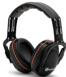
GEHÖRSCHUTZ 505 66 53-04