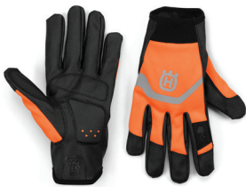
GLOVES, FUNCTIONAL LIGHT NON-SLIP 529 88 02-08