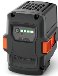
HUSQVARNA BLI40-B70 970 45 71-01