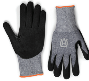
GLOVES, TECHNICAL GRIP 529 88 03-10