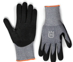
GLOVES, TECHNICAL GRIP 529 88 03-07