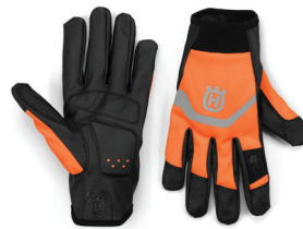
GLOVES, FUNCTIONAL LIGHT NON-SLIP 529 88 02-10